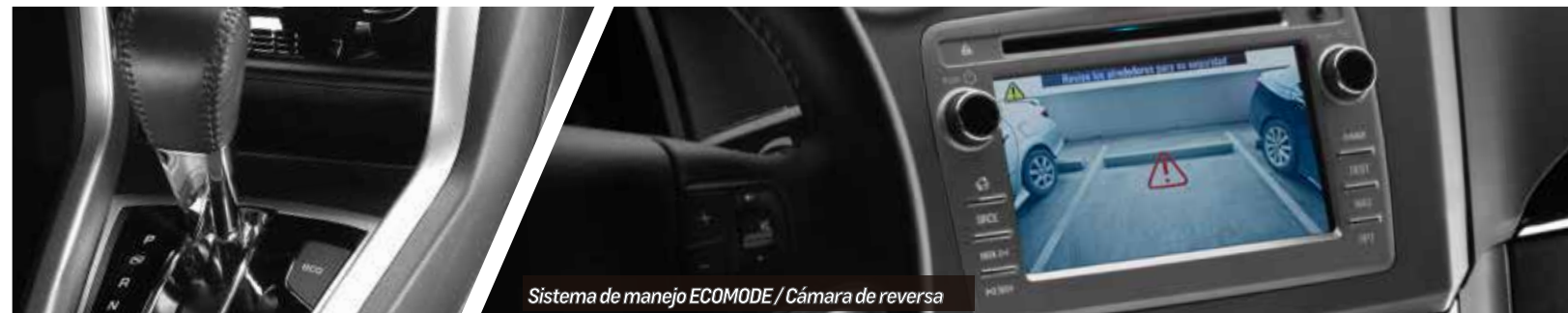
Sistema de manejo ECOMODE / Cámara de reversa

La Chevrolet Captiva Sport, cuenta con la tecnología ChevyStar My Link ofreciendo en sus diferentes versiones servicios como: localización, recuperación e inmovilización del vehículo, ChevyStar APP (Apertura y cierre de seguros, luces y bocina, localízame, sígueme, alertas de velocidad y estacionado), avisos de pico y placa, Music Streaming, manos libres con reconocimiento de voz, pantalla táctil de alta resolución, visor de fotos y videos, servicio de conserjería para reservaciones, entre otros.